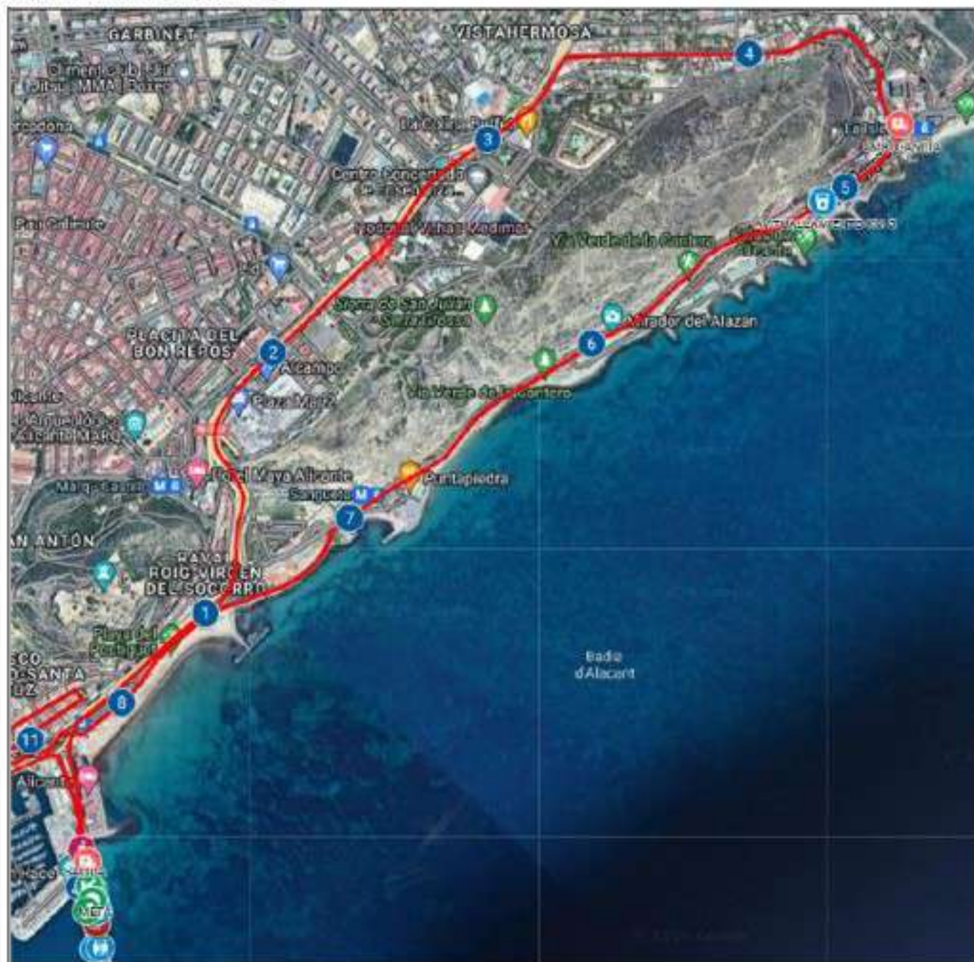
Primera parte del recorrido, común a ambas pruebas