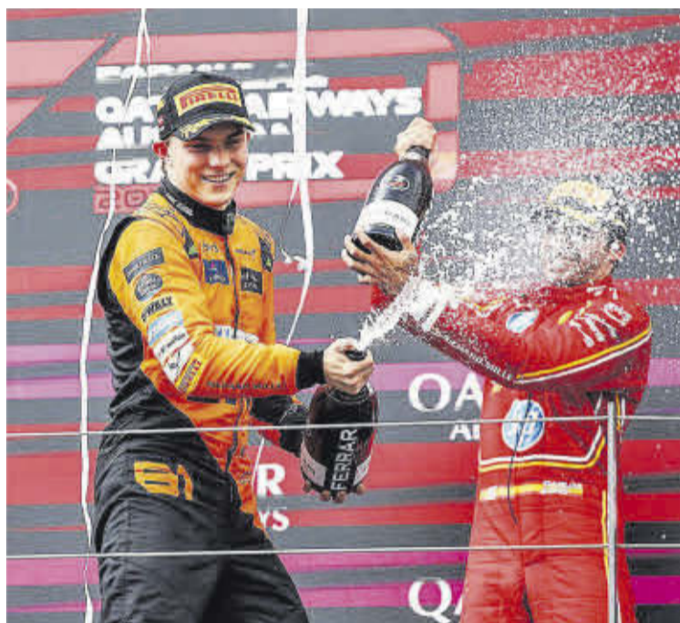
George Russell y Carlos Sainz, en el podio del Gran Premio de Austria.

Oscar Piastri (McLaren) y Carlos Sainz (Ferrari) también tuvieron recompensa y escoltaron al británico en el podio en una carrera marcada por la estrategia, la alta degradación y la presión im-